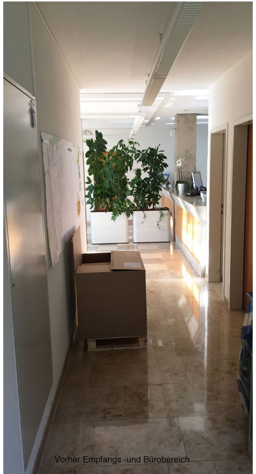
Vorher Empfangs -und Bürobereich